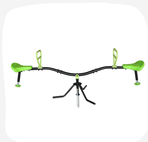
ROTUJÚCA PREVAŽOVAČKA SPINNER