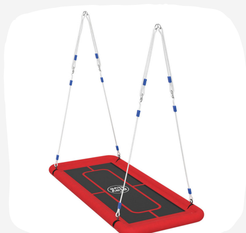
PLAYTIVE HRANATÁ HOJDAČKA