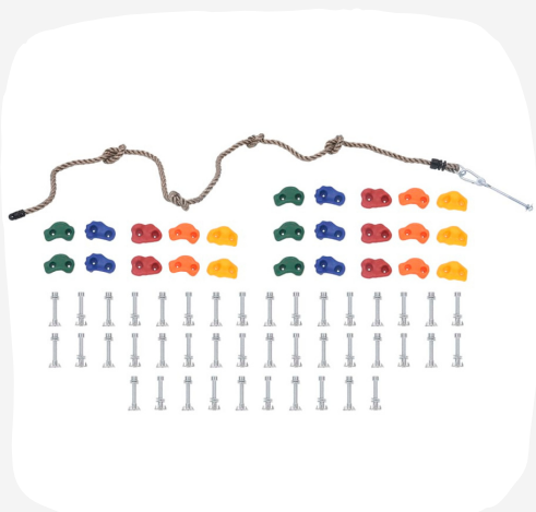
VYBAVENIE NA LEZECKÚ STENU